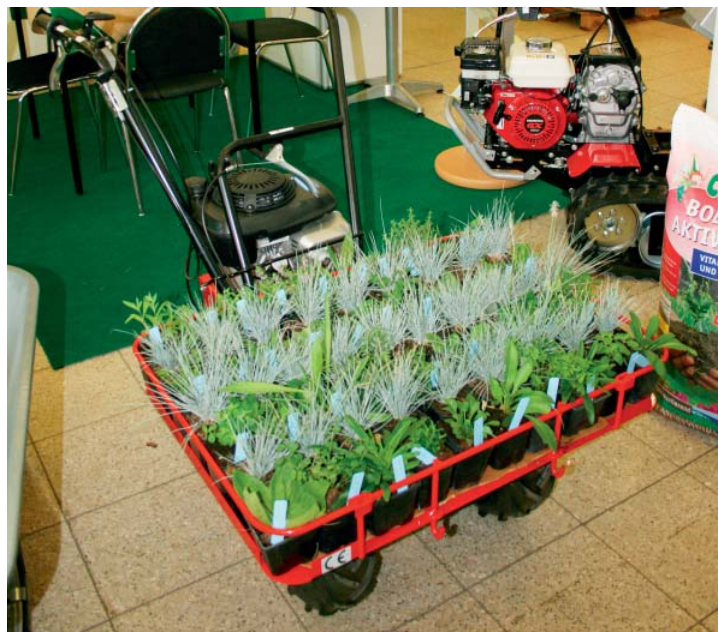
Společnost Agrostis nabízí mimo jiné rostliny pro zakládání extenzivních střešních zahrad

Společnost Syngenta Czech, s. r. o. , připravila pro zákazníky spoustu zajímavých novinek pro rok 2009. V současné době nabízí čtyři značky – S & G (letničky, trvalky), Fischer (pelargonie a poincie), Goldfish (balkonové rostliny) a Delta (macešky).