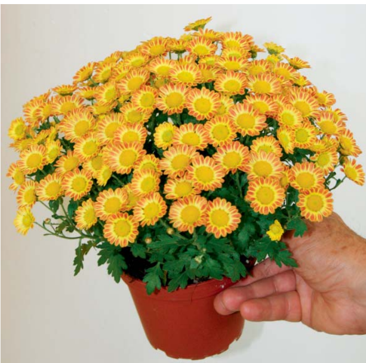
Novinkou společnosti Kaňák jsou Chrysanthemum skupiny Micronette