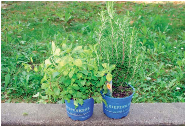
Rostliny zařazené do nového prodejního konceptu společnosti Bruno Nebelung GmbH & Co. KG jsou prodávány v modrých kontejnerech pod obchodní značkou Kiepenkerl Profi – Line