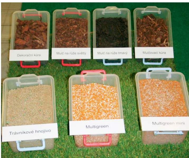
Součástí expozice firmy Agro CS, a. s., byla ukázka kůrových mulčů a hnojiv

Z firem zabývajících se realizací a údržbou veřejné zeleně a zahradní architekturou jmenujeme společnost Jena Praha, s. r. o. Široká nabídka služeb, které poskytuje jak státním, tak i soukromým subjektům, zahrnuje kompletní zpracování projektové dokumentace, terénní úpravy pozemku včetně výměny zeminy, výsadbu a následnou péči o rostlinný materiál,