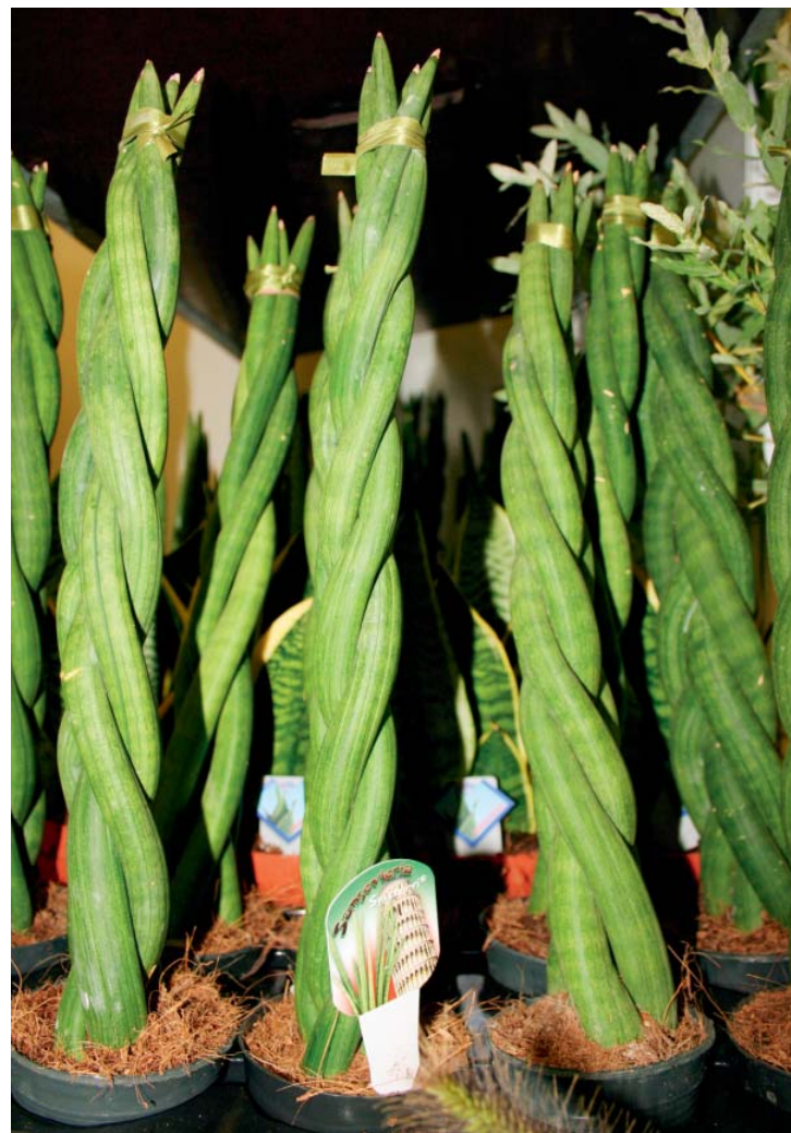
Agro Brno-Tuřany představilo novinku v oblasti pokojových rostlin – Sansevieria v působivé odrůdě 'Spaghettio'

Mezi zajímavé aktivity společnosti BB com, s. r. o. , patří výroba a aplikace střešních substrátů. Nejedná se o žádnou jednoduchou záležitost – podle slov Miloslava Bartoše musí být substrát schopen zadržet přívalové deště a zachránit vodu poté pomalu vypustit. K dispozici jsou dva základní typy substrátů – pro extenzivní a pro intenzivní plochy. Aplikace se provádí pomocí upravených cisteren – do jedné se odhadem vejde 35 až